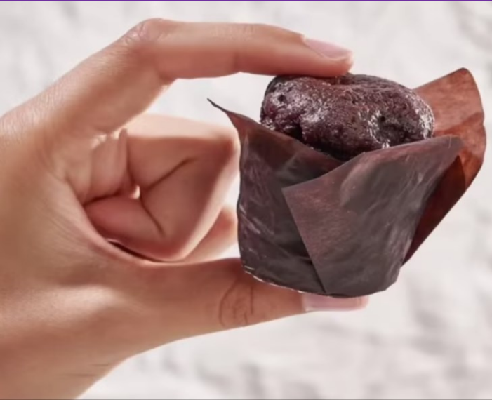
130519 Mini Choco chips