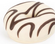
13186 - mini Hoop choco

γρ.: 34 εκ.: 7 τιμχ/ κιβ.: 60 κιβ./παλέτα: 128 απόψυξη: 20' ψήσιμο: Δεν χρειάζεται