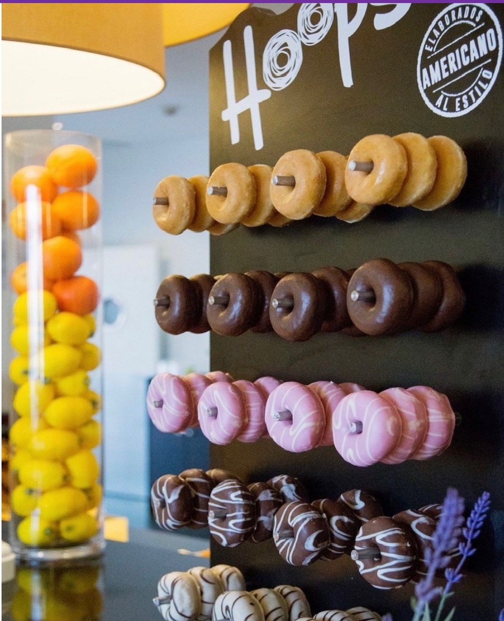
13186 - mini Hoop choco