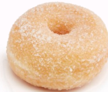
13669 - Mini Sugar Hoops Loukoumadaki

γρ.: 35 εκ.: τμχ/ κιβ.: 48 κιβ./παλέτα: 96 απόψυξη: 30' -45' ψήσιμο: Δεν χρειάζεται