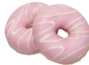
13187- mini Hoop kiss strawberry

γρ.: 34 εκ.: 7 τιμχ/ κιβ.: 60 κιβ./παλέτα: 128 απόψυξη: 20' ψήσιμο: Δεν χρειάζεται