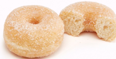
13553 - Sugar Hoops - Loukoumas

γρ.: 55 εκ.: 9 τμχ/ κιβ.: 48 κιβ./παλέτα: 96 απόψυξη: 30' -45' ψήσιμο: Δεν χρειάζεται